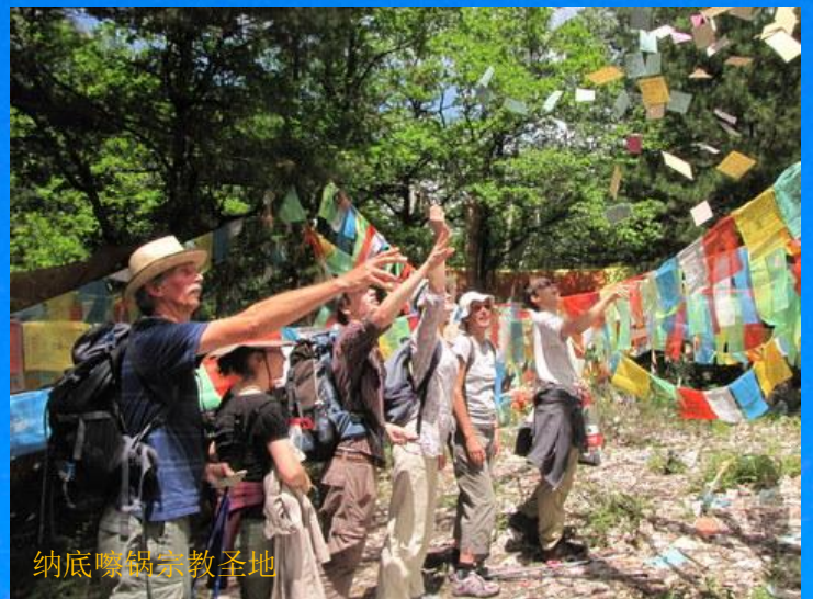
纳底喇喇宗教圣地